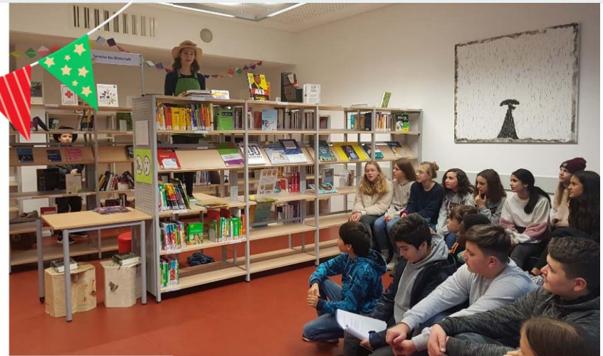
In einer Theaterszene wird die Welt der Bücher lebendig