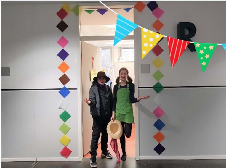
Feierliche Eröffnung, November 2019